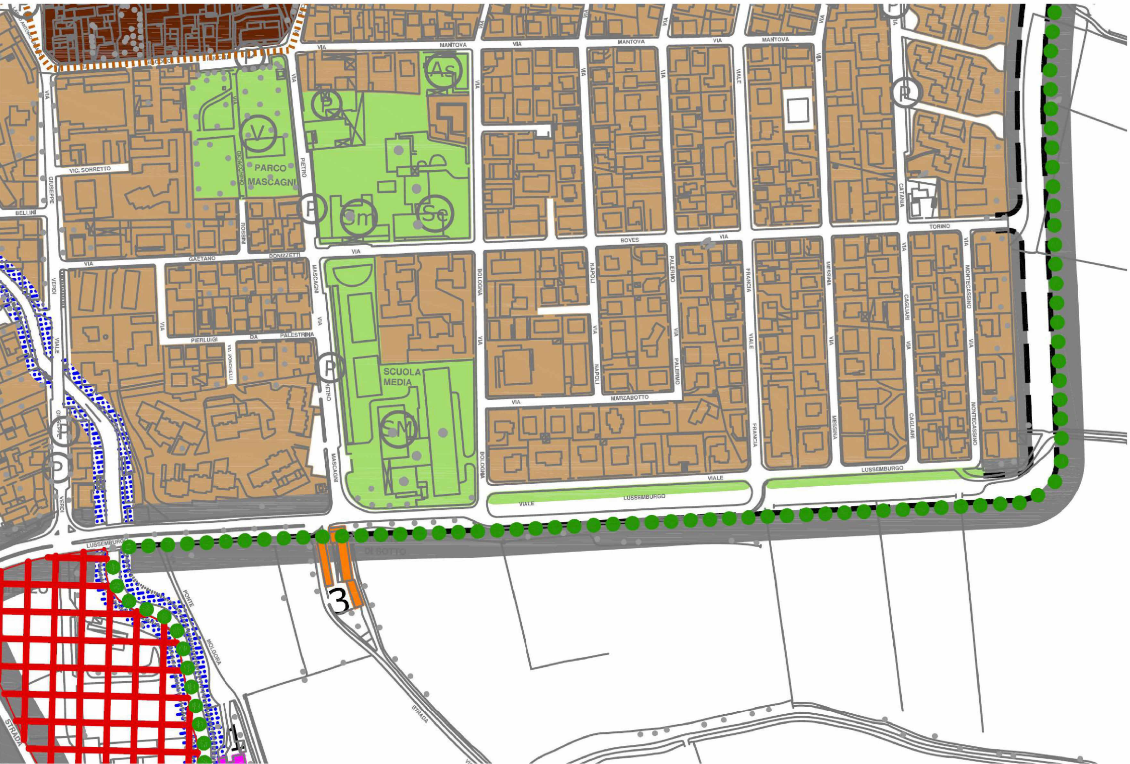
aree per attrezzature al servizio degli insediamenti residenziali e al servizio degli insediamenti produttivi